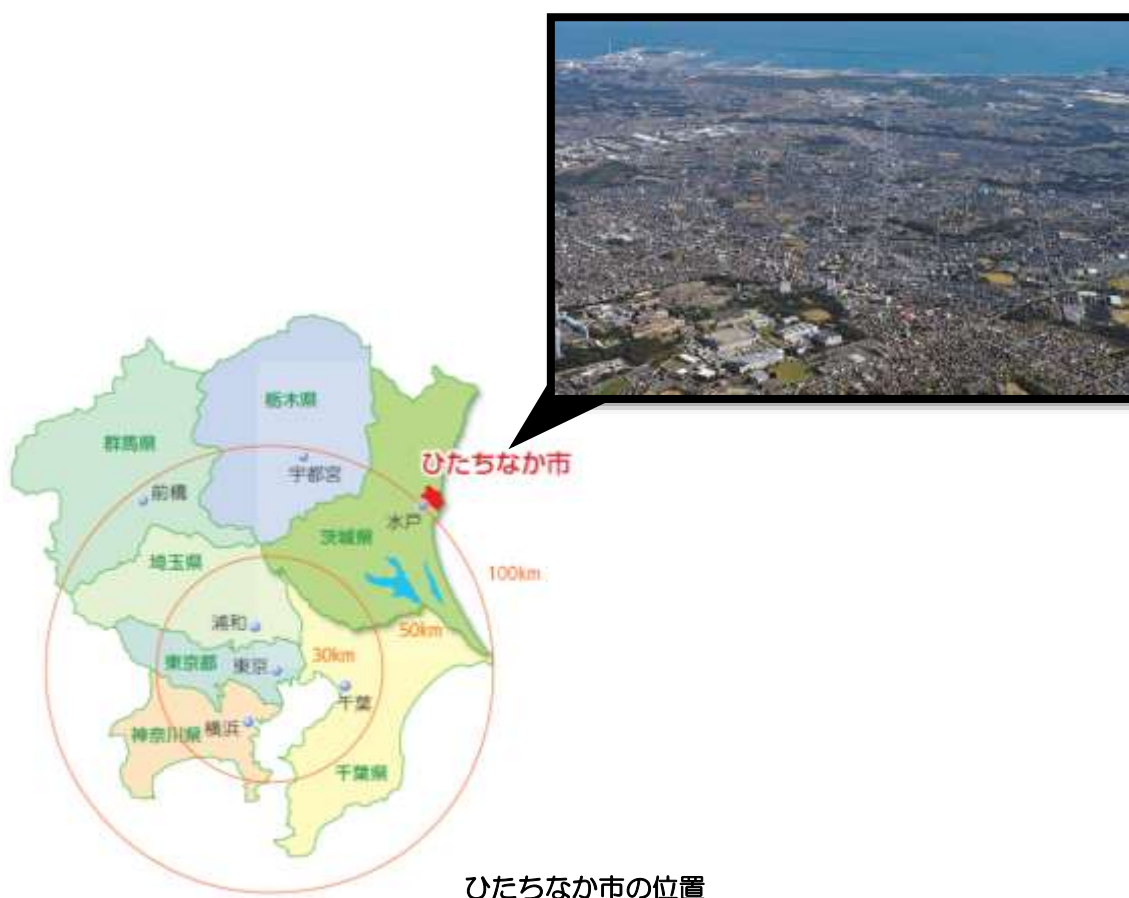
ひたちなか市の位置

市域は、太平洋と那珂川下流域に位置する海拔7m前後の低地地区と、阿武隈山系から南東に緩やかに傾斜している那珂台地と呼ばれる海拔30m前後の起伏の少ない平坦な台地地区とに分けられています。低地地区は、漁港を中心に市街地が形成され、那珂川流域は水田地帯となっています。一方、台地地区は、駅を中心に市街地が形成され、都市化が進行していますが、周辺は畑地も多く、また、中小河川が市街地にくさび状に入り込み、台地縁辺部は豊かな緑が帯状に連なっています。