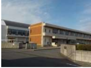
大島中学校 徒歩約9分