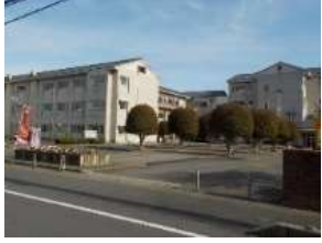
外野小学校 徒歩約8分