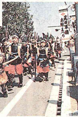
▲武田軍団出陣式・パレード