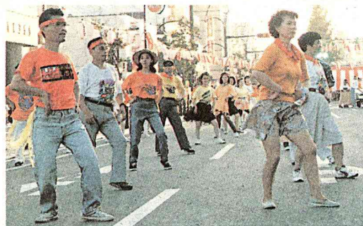
ダンスパレードには、仮装部門、踊り部門に1,500人あまりが参加

ひたちなか市ホームページ http://www.net-ibaraki.ne.jp/hitachinaka/