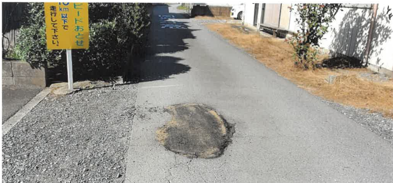
陥没部写真 大きさ約 80 c m × 40cm