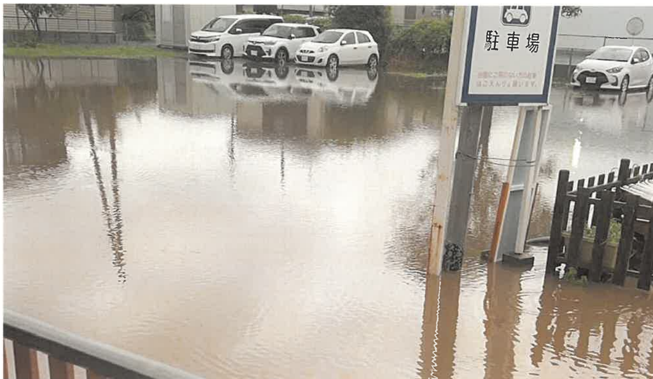
昨年 9 月豪雨による幼稚園周辺水没の様子