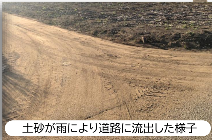
土砂が雨により道路に流出した様子

農地所有者や耕作者の皆様には、こうした問題を引き起こさないように、土砂等の流出防止対策を実施していただきますよう、ご理解・ご協力をお願いします。