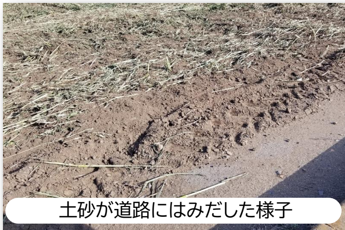
土砂が道路にはみだした様子