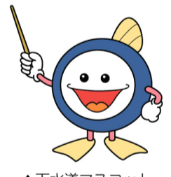
▲下水道マスコットキャラクター「スイスイ」