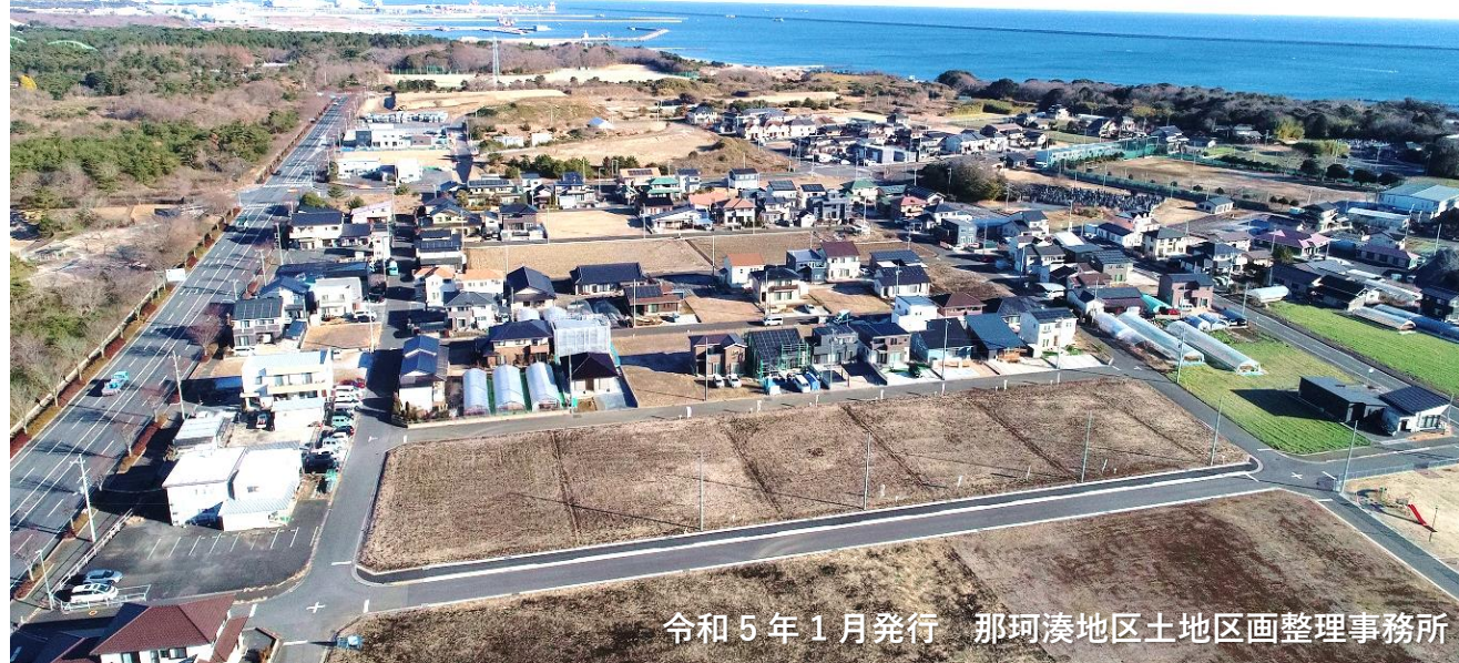
令和5年1月発行 那珂湊地区土地区画整理事務所

皆様におかれましては、日頃から「阿字ヶ浦土地区画整理事業」の推進にご理解ご協力を賜り厚く御礼申し上げます。