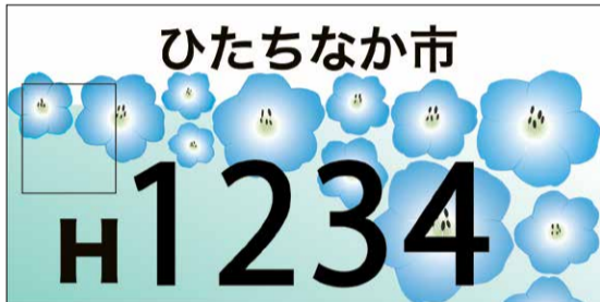
50cc以下用ナンバープレートイメージ