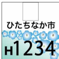
特定小型 原動機付自転車用