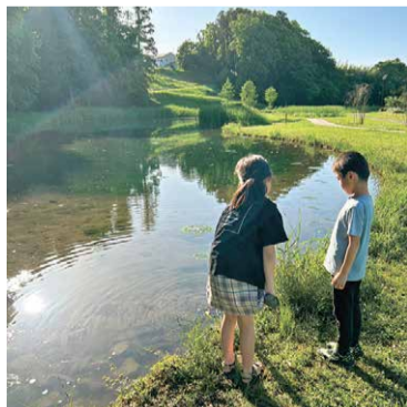
親水性中央公園のビオトープ