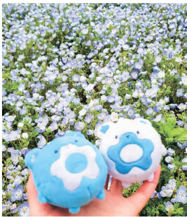
ネモフィラとルリィ&アイシィ(国営ひたち海浜公園/4月22日撮影)市公式 Instagram [hitachinaka_official]では、四季折々の心に残る風景を紹介しています。