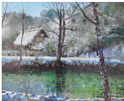
◀絵画特賞「春は来ぬ」