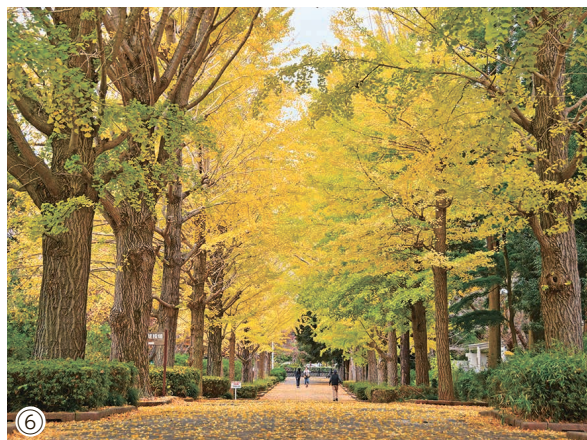
【問合せ】広報広聴課☎内線 1151、2