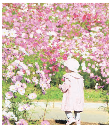
国営ひたち海浜公園のコスモス(11月3日撮影)

市公式 Instagram [hitachinaka_official] では、四季折々の心に残る風景を紹介しています。