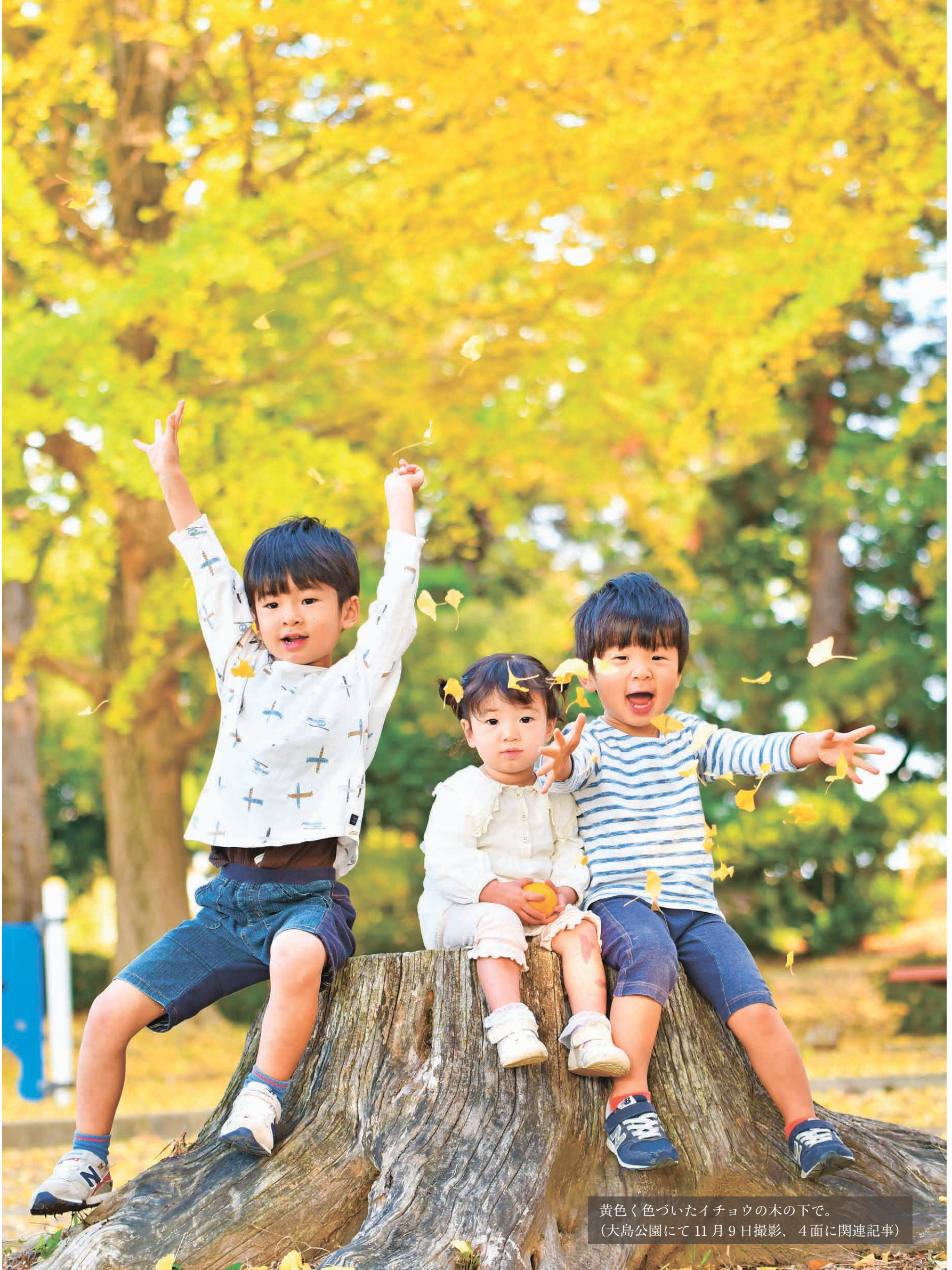
黄色く色づいたイチョウの木の下で。 (大島公園にて11月9日撮影、4面に関連記事)

発行 ひたちなか市広報広聴課 ☎029(273)0111 編集 〒312-8501 ひたちなか市東石川2丁目10番1号