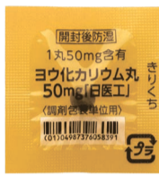
3歳以上用丸剤 (有効期限5年)

すでにお受け取りの方も、お手持ちの安定ヨウ素剤の有効期限を確認しましょう。 有効期限を過ぎた薬剤は更新が必要です。