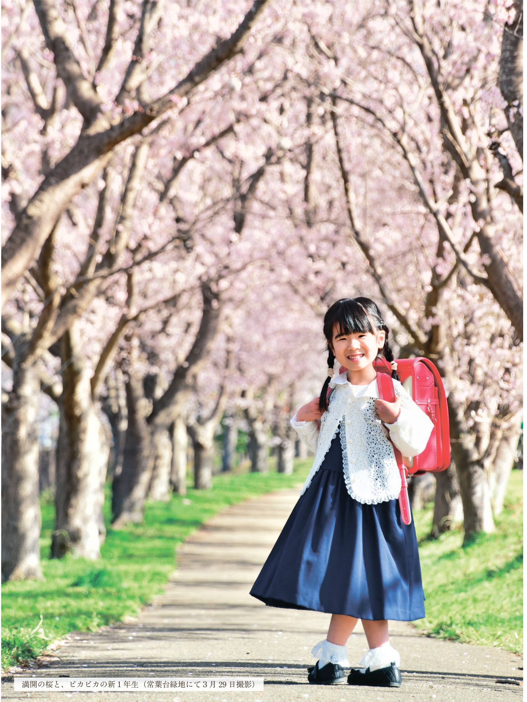
満開の桜と、ピカピカの新1年生（常葉台緑地にて3月29日撮影）

発行 ひたちなか市広報広聴課 ☎029(273)0111 編集 〒312-8501 ひたちなか市東石川2丁目10番1号