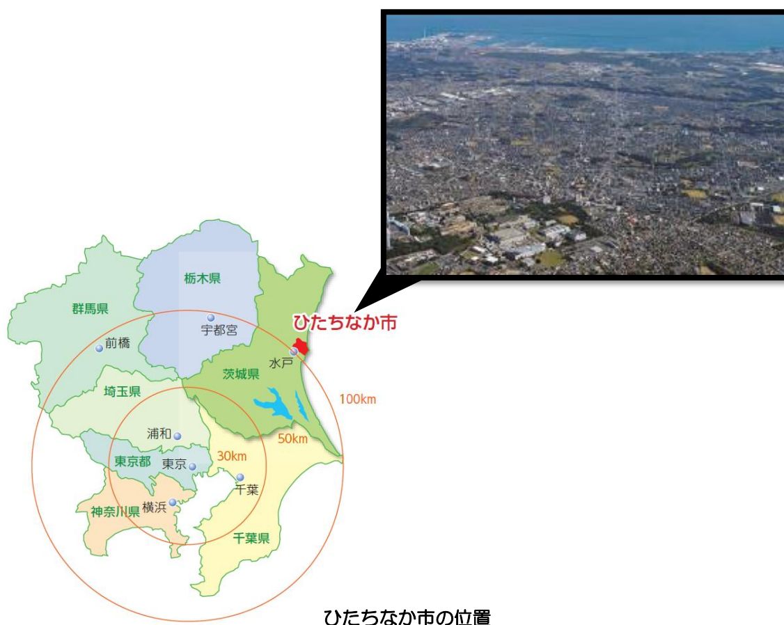
ひたちなか市の位置

市域は、太平洋と那珂川下流域に位置する海拔 7m 前後の低地地区と、阿武隈山系から南東に緩やかに傾斜している那珂台地と呼ばれる海拔 30m 前後の起伏の少ない平坦な台地地区とに分けられています。低地地区は、漁港を中心に市街地が形成され、那珂川流域は水田地帯となっています。一方、台地地区は、駅を中心に市街地が形成され、都市化が進行していますが、周辺は畑地も多く、また、中小河川が市街地にくさび状に入り込み、台地縁辺部は豊かな緑が帯状に連なっています。