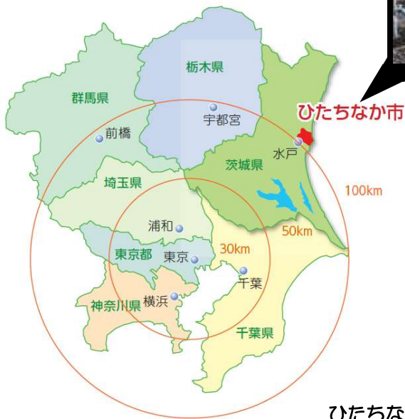
ひたちなか市の位置