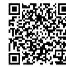
▲市公式LINE友だち登録