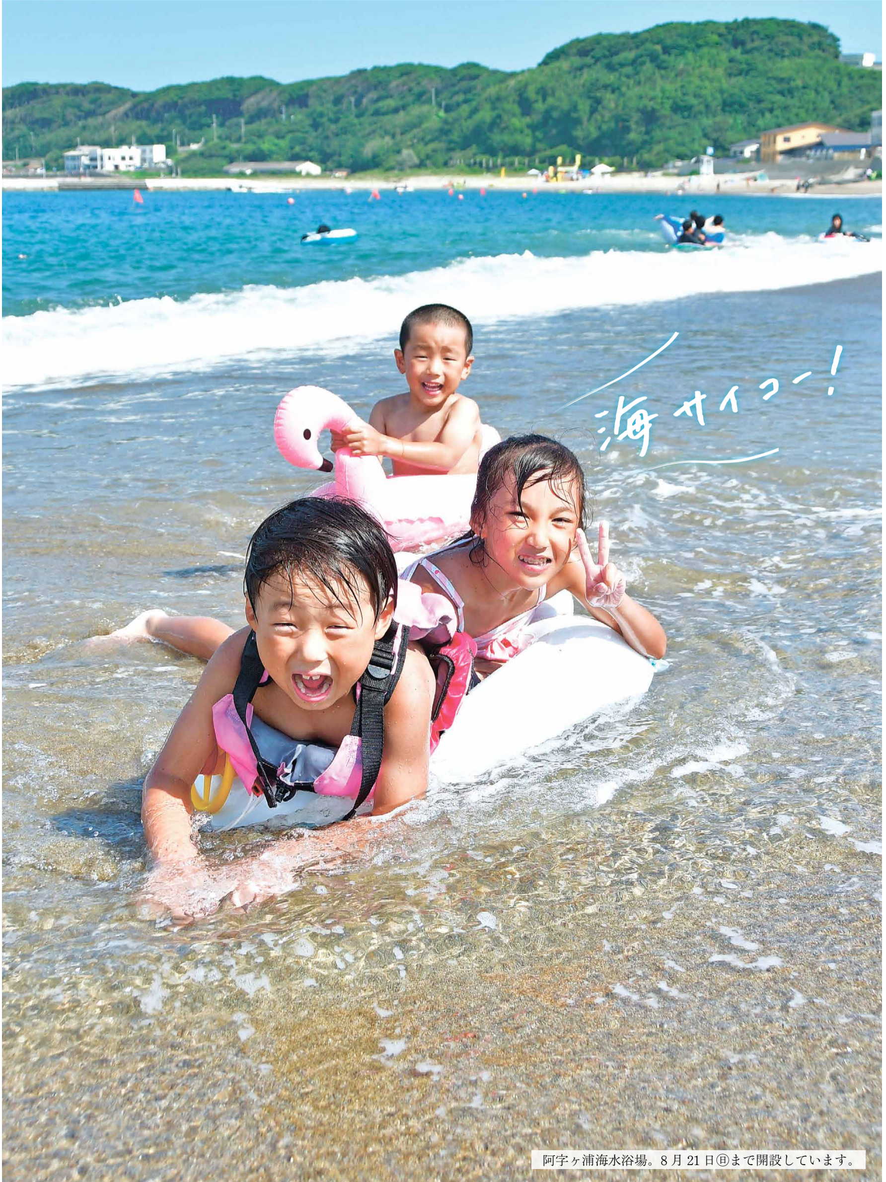
阿字ヶ浦海水浴場。8月21日㊤まで開設しています。

発行 ひたちなか市広報広聴課 ☎029(273)0111 編集 〒312-8501 ひたちなか市東石川2丁目10番1号