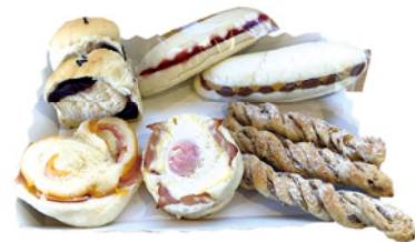
▲ どれも美味しそうで悩むな～