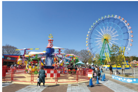
▲色んなアトラクションがある『プレジャーガーデン』何に乗ろうかな～