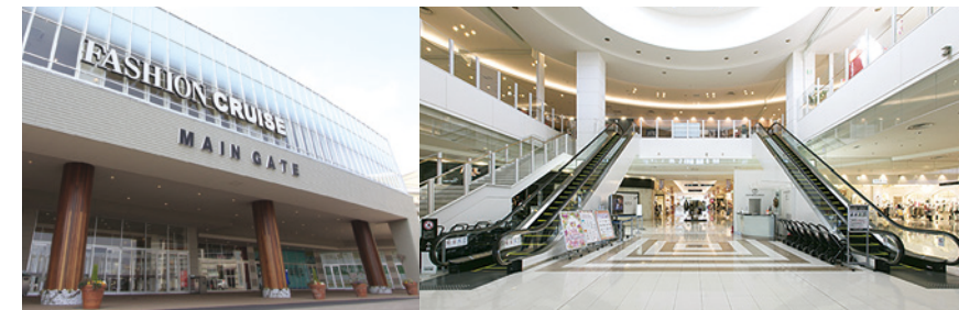
▲ ショッピングを楽しむ “ファッションクルーズ”