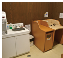
▲スロープや授乳室があって安心です