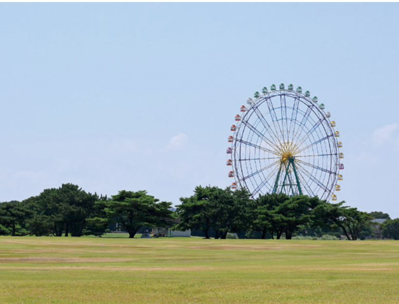
▲広々とした『大草原』で、最高の秘密基地ができそう！