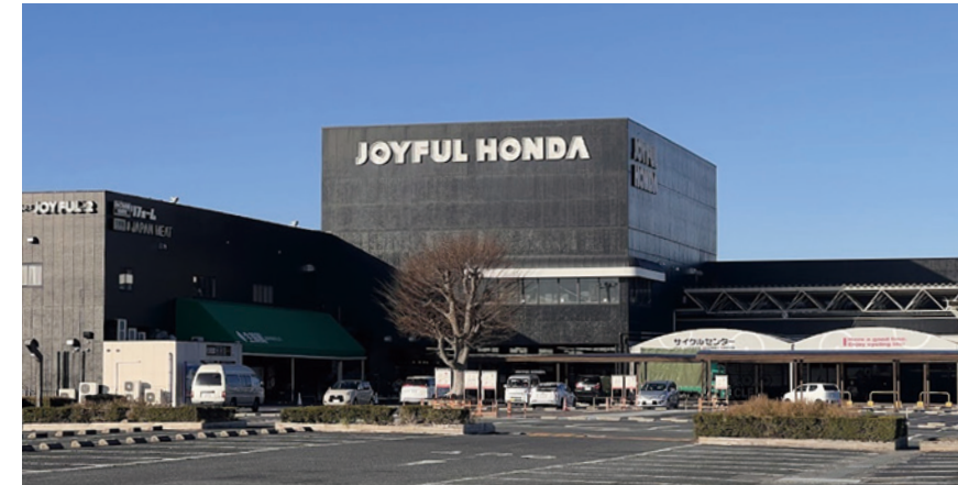
▲ 大型ホームセンター “ジョイフル本田”