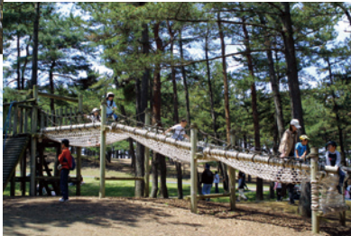
▲『林間アスレチック広場』でアスレチックに挑戦