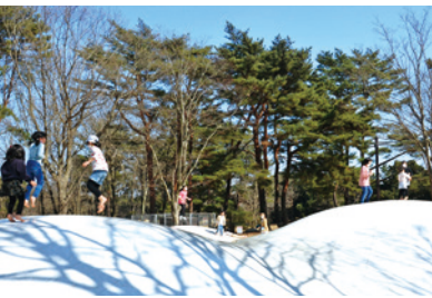
▲ふわふわトランポリンの『びよんびよんたまご』で飛んだり跳ねたり