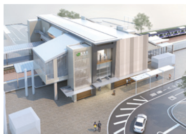
▲ 新佐和駅西口完成予想図

近隣には保育園や幼稚園も多く、共働き世代が安心して子育てできる環境が整っています。ゆとりある住まいで、子どもの成長を感じながら家族と共に末永く暮らせる地域です。