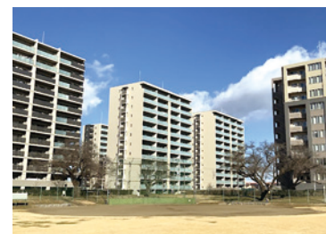
▲ 立ち並ぶマンション