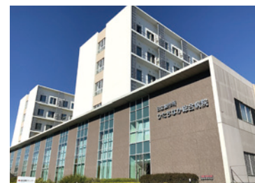
▲ 日立製作所ひたちなか総合病院