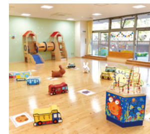
▲ 子育て支援センターふあみりこ

子育て世代に人気の洗練されたまち ひたちなか市の玄関口である勝田駅は、水戸市や日立市だけでなく首都圏へのアクセスもスムーズ。 そんな勝田駅の周辺には、スーパー、総合病院など生活に欠かせないものから、子育て支援センターや文化会館などの子どもからお年寄りまで楽しめる施設、運動ひろばやフィットネスジムなどのスポーツ施設まで、日々の生活に潤いをもたらす施設が充実しているだけでなく、その全てが徒歩圏内に集まっています。 都市と自然が調和するこの地域は、マンションが多く立ち並び、周辺には四季を感じられる公園が点在しています。暮らしやすさを追求した快適な暮らしが魅力です。