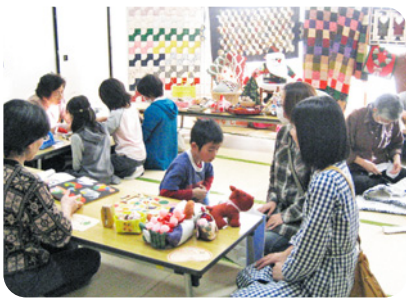
◀ 布のリメイクコーナー