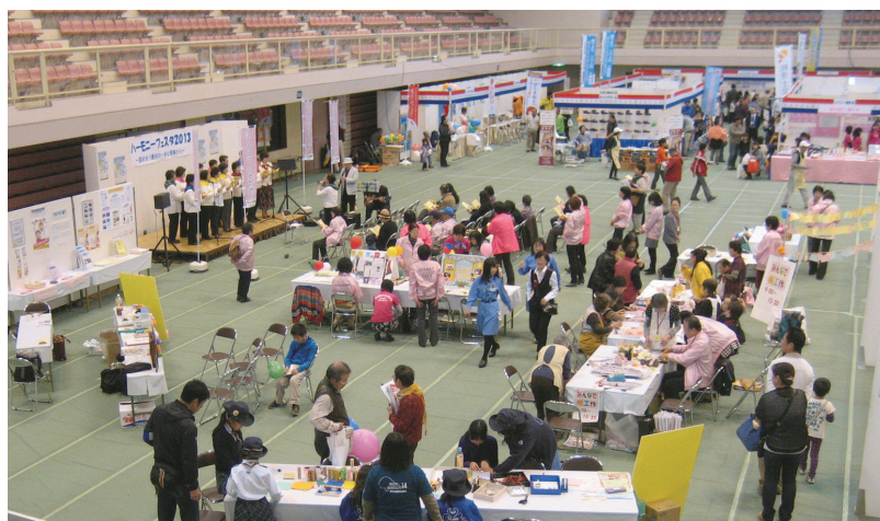
▲ハーモニーフェスタ 2013 会場の様子