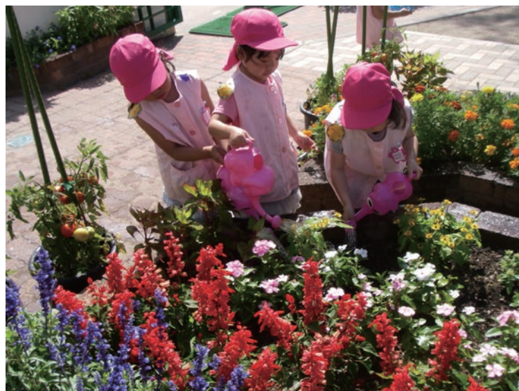
▲園児たちの作業の様子