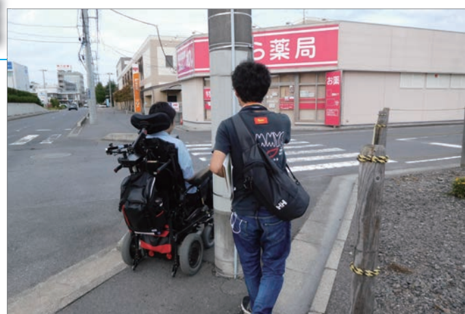
▲ 勝田駅周辺のまち歩きの様子

道路や公共施設にある段差や、看板・案内板の表現に焦点を当てるなど、参加者それぞれの視点が活きる講座となっています。