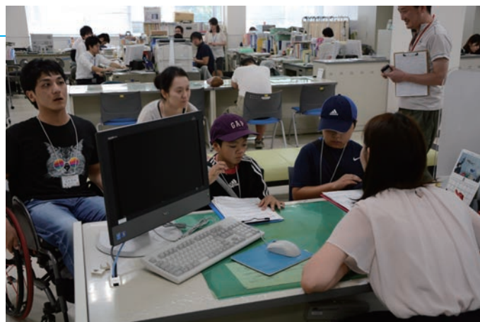
▲ 市役所探検の様子

体験を通して多くの人と触れ合うことでまちづくりへの興味や関心を深め、子どもたちにとって大きな財産となっています。