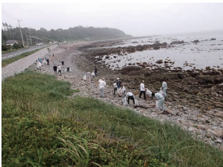
▲海岸クリーン運動

那珂川水系クリーン運動では、毎年7月の「河川愛護月間」に合わせて、河川愛護の精神を育むため、那珂川水系の4つの川（那珂川、中丸川、本郷川、大川）の沿岸の除草やゴミ拾いを実施しています。