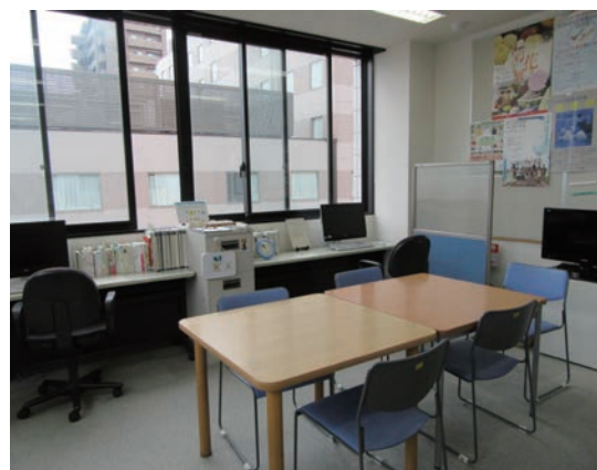
▲ 事務室内会議スペース