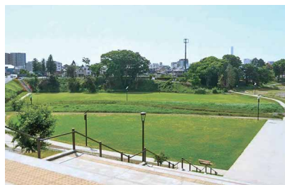
親水性中央公園 東石川二反田 389 ほか

お気に入りスポットは、親水性中央公園です。広々としていて、のんびりできるいい公園だなと思います。街の真ん中に大きな公園があるのは、ひたちなか市の魅力だと思っています。