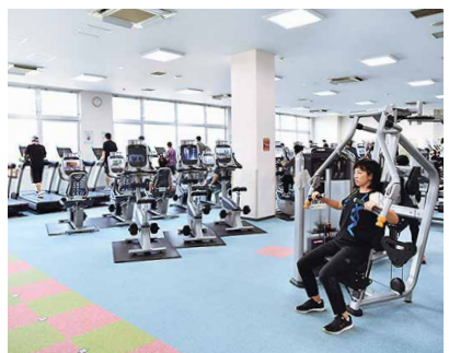
フィットネスクラブ スパーク青葉

私のオススメスポットは、スパーク青葉。社会人になってから運動不足だったので通い始めました。豊富なマシンが揃い、開放的な空間で体を動かすと、気持ちがいいです。通い始めてすぐ、家族や友人に体が引き締まってきたねと言われ効果が実感できました。今では、週に5日の筋力トレーニングが趣味になっています(笑)