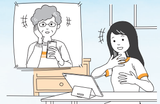
●家族や友人との会話