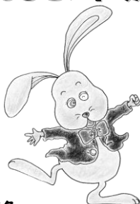
オリジナルキャラクター ちゃあくん