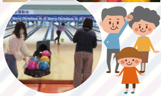
つかの間の開放感