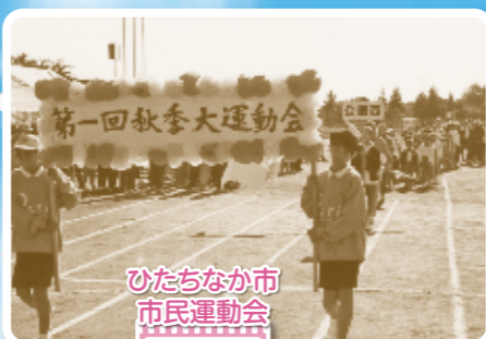
ひたちなか市 市民運動会 平成7年 第1回

初の栄冠は堂端自治会 第1回田彦中学区秋季大運動会開催 本会設立(勝田市) 平成6年 第1回