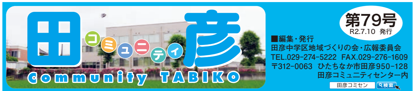
背景は、田彦コミュニティセンター南側より

過度な社会的距離の確保を強調するとコミュニティシオンや人と人との繋がりが希薄にならないかが、心配になります。地域の方々の協力を得て地域のネットワークを広げ、本会の運営も多様性にかけていきたいと考えております。