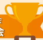
2023年 自治会対抗得点表 (1位:5点, 2位:4点, 3位:3点, 4位:2点, 5位:1点)