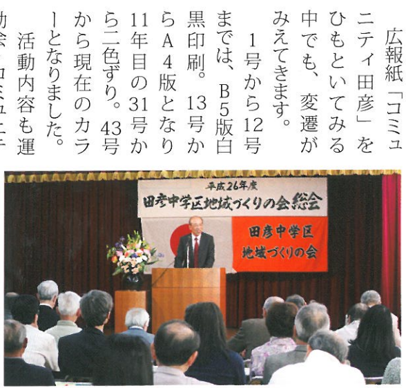
4月12日総会が開催されました。

広報紙「コミュニティ田彦」をひもといてみる中でも、変遷がみえてきます。 1号から12号までは、B5版白黒印刷。13号からA4版となり11年目の31号から二色ずり。43号から現在のカラーとなりました。 活動内容も運動会・コミュニティまつり・各部会の行事の他に、平成十九年には、最近やっと犯人が見つかった栃木県の幼児殺害事件をきっかけに、各自治会が「安心・安全まちづくり」のスローガンのもと各々にパトロールがはじまりました。 二十年には、田彦中学区の青色防犯パトロール隊を結成。二十三年には、「ひたちなか市自立と協働のまちづくり市民会議」の説明会があり、市民会議が発足しました。 昨年からは、公民館が地域移管となり、名称も田彦コミュニティセンターに変わり地域づくりの会が運営にあたることになりました。 このように多くの方々熱い思いやご努力のおかげで今日のあることに思いを馳せ、今後の更なる発展へのご協力をお願いし、併せて皆様方のご健勝をご祈念申し上げます。