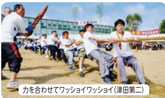
力を合わせてワッショイワッショイ(津田第二)