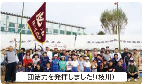
団結力を発揮しました!(枝川)