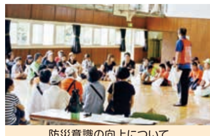
防災意識の向上について

災害発生時のサイレン後に本町第二公園に一時避難し、その後指定避難所の堀口小学校に避難しました。井戸水操作、防災倉庫の備蓄等の確認をし、いざという時に迅速な行動がとれるようになる有意義な訓練でした。