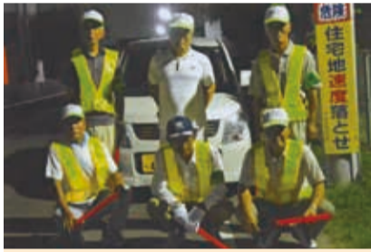
パトロールメンバー集合!

夜間防犯パトロールは夏場の行事として恒例化し、繰り返すことで地域の安全・安心がより向上できることを考えています。