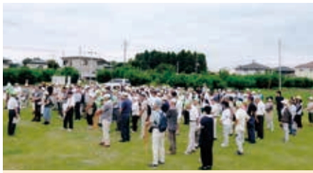
広場に集合された皆さん

8月26日(土)コミュニティ広場において市総合防災訓練として避難訓練を実施しました。午前9時、市のサイレンを合図に各自宅において身の安全を確保したのち、組長先導のもと広場に255名が集まりました。又、小地域ネットワーク利用者の方を協力員・組長の支援者による小グループの組織により安否確認訓練を行いました。