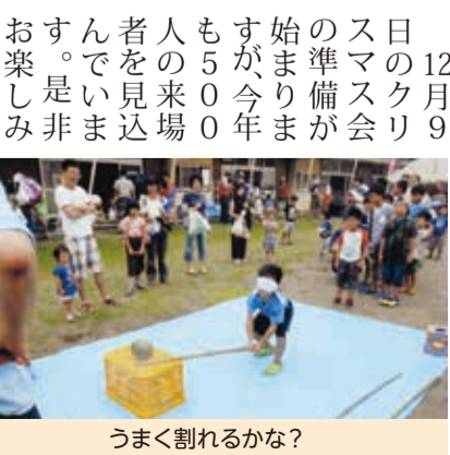
うまく割れるかな?

年少者は、ぬり絵や折り紙を小学生はゲームやボール遊びを多くの中学生は卓球や人生ゲームを自由に楽しんでいます。