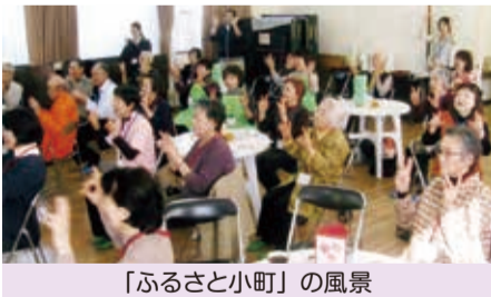
「ふるさと小町」の風景

型サロンとして昨年10月に誕生しました。笑顔あふれる楽しい2時間です。皆様のご参加をお待ちしています。