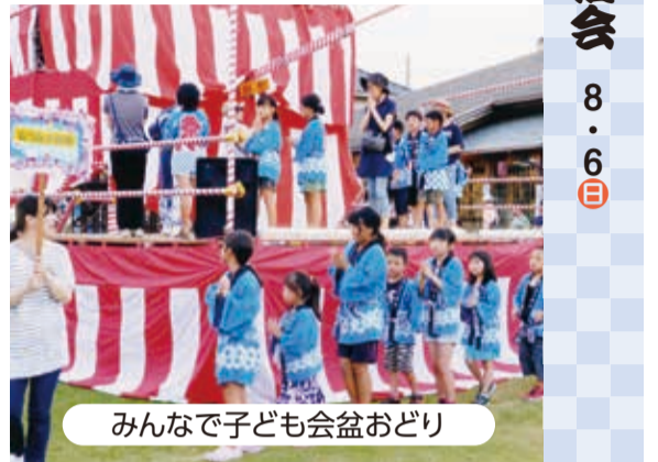
みんなで子ども会盆おどり