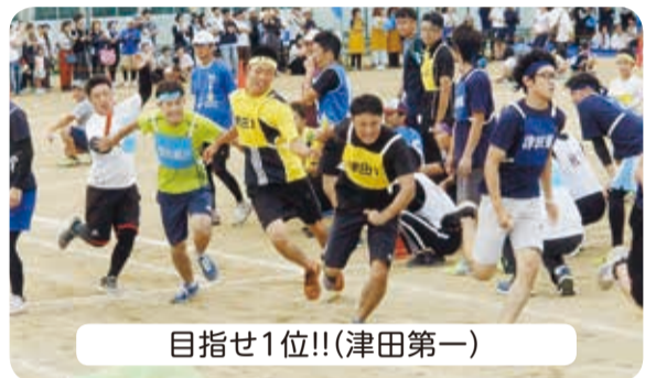
目指せ1位!!(津田第一)