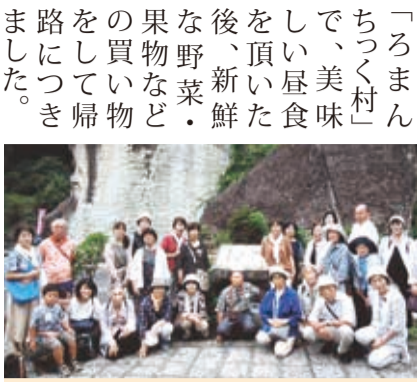
大谷資料館前で自治会員の皆さん

7月24日(月)市毛南自治会員29名は、栃木県大谷資料館を見学してきました。地下30mの大谷石採掘場跡は夏でも10度以下と涼しく、地下神殿のよう、係員の説明を聞きながら幻想的な雰囲気を楽しみました。