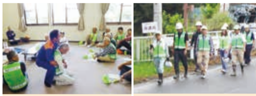
救急救命などの講習会 各班ごとに避難誘導訓練

参加者は130人の地域住民の参加がありました。今回は、過去の水害経験を基に安否確認や避難誘導等の訓練と、救急救命などの講習会も行いました。訓練により、防災意識の向上が図れました。