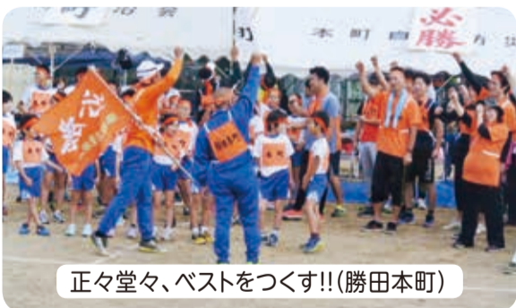
正々堂々、ベストをつくす!!(勝田本町)