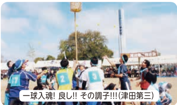
一球入魂! 良し!! その調子!!!(津田第三)