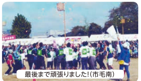
最後まで頑張りました!(市毛南)