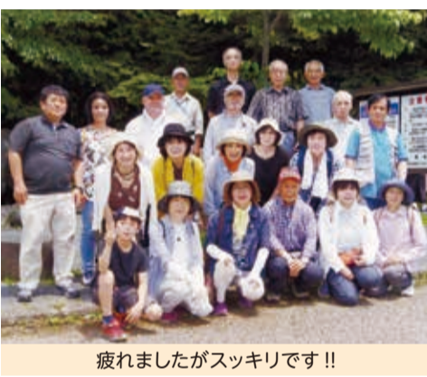
疲れましたがスッキリです!!

午後は歴史の重みを感じさせる寺山観音寺を参拝し、帰りの安全を祈願して無事終了できました。