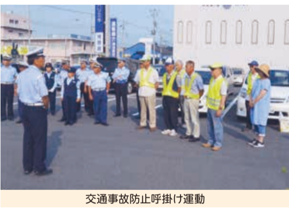
交通事故防止呼掛け運動