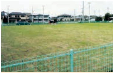
完成間近の久保公園

新公園は、堀口小学校への通路に面しており、地区の中央に位置しておりますので住民の皆様から幅広く使用されるものと期待されます。皆様、一度、下見をして見たいか、かがでしようか。