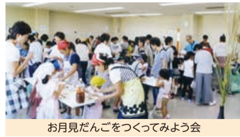
お月見だんごをつくってみよう会