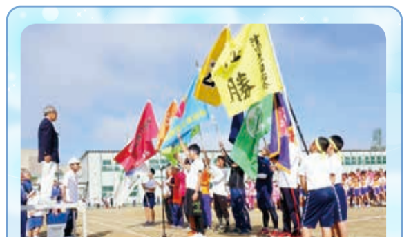
兼山大会会長に健闘を誓う