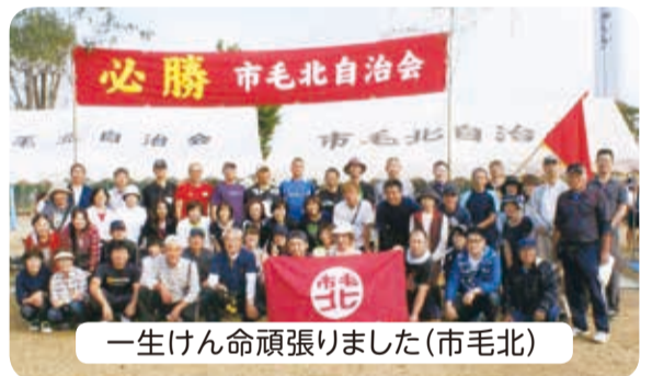
一生けん命頑張りました(市毛北)