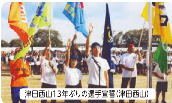
津田西山13年ぶりの選手宣誓(津田西山)