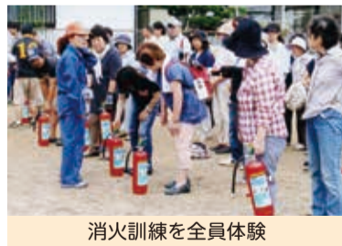
消火訓練を全身体験

8月26日(土)市の総合防災訓練に併せて、津田集会所と津田小学校に124名が集合し防災訓練を実施しました。今回の訓練は、自主防災会の組織員が『実際の災害時に、集まった方で何が出来るか』を体験するために、事前訓練説明会をせずに実行しました。