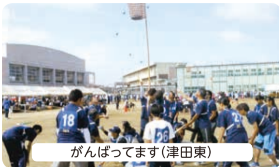
がんばってます(津田東)