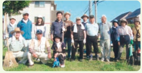
仲坪公園除草作業【武田】