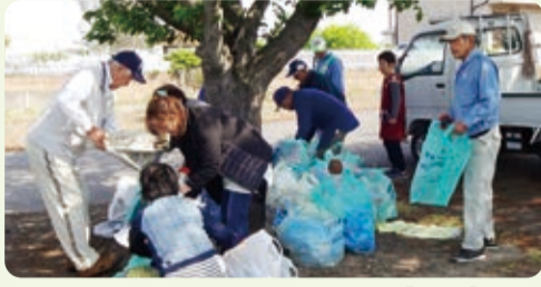
地域内の不法投棄物を回収【枝川】