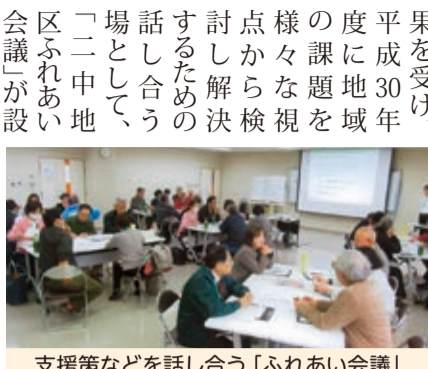
支援策などを話し合う「ふれあい会議」