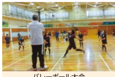
バレーボール大会

令和元年度の部会活動は、6月から事業がスタートし、バレーボール大会から始まり高齢者レク及びソフトボール大会を予定しております。今後はメインとなる秋季運動会の準備を重点に進めてまいります。今年度は茨城ゆめ国体、ゆめ大会が開催されますので活動時期を一部変更して行います。今年も健康寿命の強化を推進し、事業展開をしていきたいと思います。