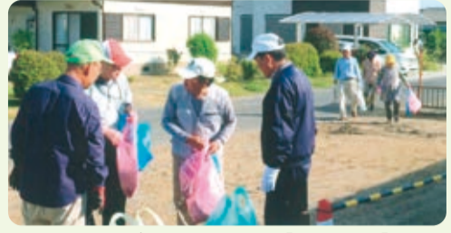
拾ったゴミを集積場に【津田第二】