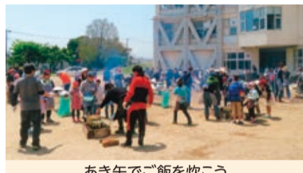
あき缶でご飯を炊こう

晴天強風の5月12日(日)体験学習『あき缶でご飯を炊こう』を津田小学校を会場に実施しました。参加者120名が、これまで薪の火を使い、あき缶でご飯を炊いて鍋でカレーもつくりました。子どもたちは大人が見守るなか、米とぎ、野菜切りなど真剣に取り組む姿、み、カレーライスを美味しく食べた後は、片付けも協力して、体験を通して楽しい時間を過ごしました。