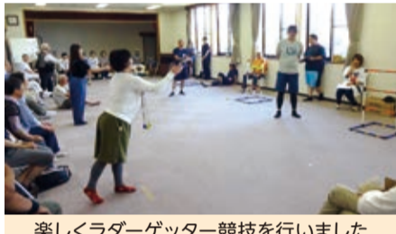
楽しくラダーゲッター競技を行いました

昼食に合わせ表彰式と懇親会を実施し、地域の顔合わせなど、今後の活動に向けての動きも盛り込まれた有意義な交流会でした。