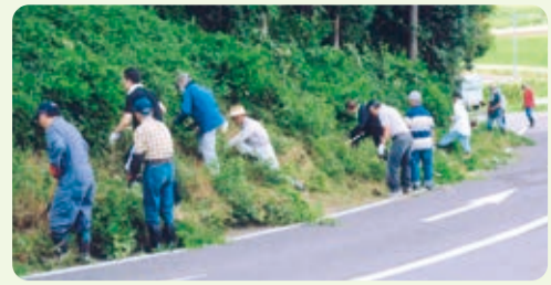
環境美化活動【津田第一】