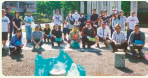
きれいになりました!!【市毛北】