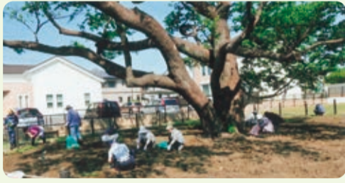
堀口公園 シンボル山桜の清掃【堀口】