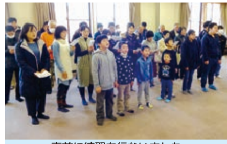
事前に練習を行ないました

祭典への出場に向けて、事前に参加者募集と練習を行いました。当日は60名の老若男女が参加し、堂々と素晴らしい合唱を披露できました。地域コミュニティの拠点である小学校を、あらためて認識した祭典でもあり、また地域の支援などで参りま