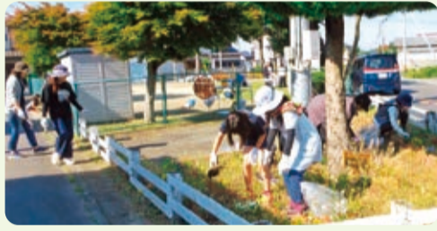
西山公園除草作業【津田西山】