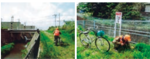
不法投棄パトロール中

環境部会の行事の中で、不法投棄監視パトロールを年4回実施してまいります。各自自治会2名にて自分の自治会内を見廻り監視してまいります。オレンジ色のジャケット・帽子着用してのパトロールですのでかなり目立っているかと思っております。最近では悪質・多量の不法投棄は少なくなりましたが、以前として家庭ゴミ・空き缶・ペットボトルのポイ捨てが無くなりません。ごみゼロは永遠のテーマです。