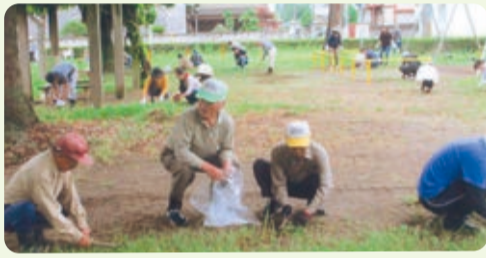
第二公園の除草作業【勝田本町】