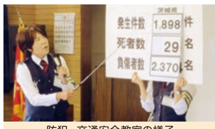
防犯・交通安全教室の様子