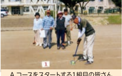
Aコースをスタートする1組目の皆さん

トロールが難しい中、ホールインワンも出て、和気あいあいの楽しいグラウンドゴルフの集いとなりました。