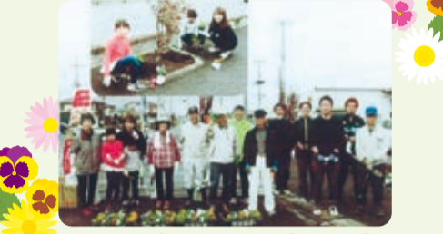
街路にパンジー植栽【津田東】