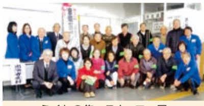
ふくわの集 スタッフ一同

平成から令和へと元号が変わりましたが、文化部会の単独行事計画も前例にとられず、柔軟に対応していきたいと考えております。内容の充実とともに有意義なものへと工夫を凝らしてまいります。