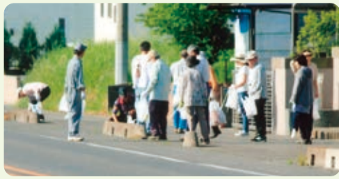
ごみゼロ運動【津田第三】