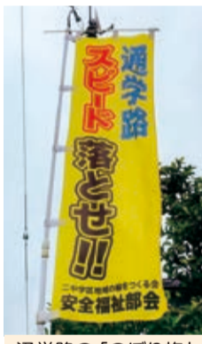
通学路の「のぼり旗」

平成30年度は前年同様交通事故防止啓発のぼり旗を作成し自治会にお届けしました。今年度も皆様のご協力を得ながら事故のない安全、安心の地域づくりを目指して安全福祉活動に励んでまいります。