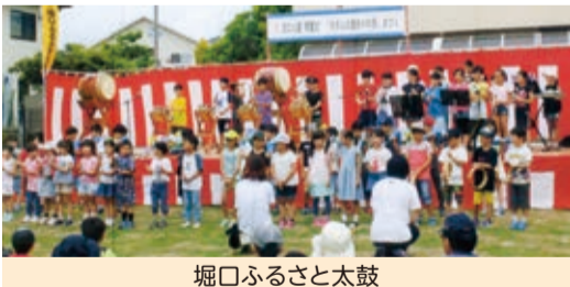
堀口ふるさと太鼓

当日は、恒例のホタルの里あやめ苑まつりも開催され、ふるさと太鼓の競演と自治会各団体のいろいろな模擬店で盛り上がりしました。