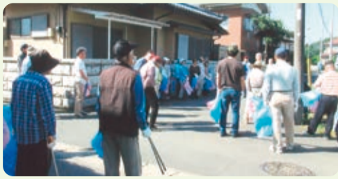
環境美化運動の日【市毛南】