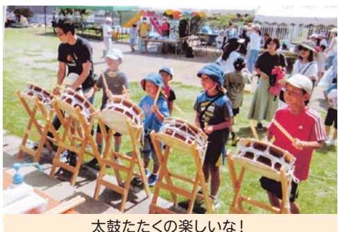
太鼓たたくの楽しいな!

また、今回は制限を撤廃し、焼きそばやかき氷、ポップコーンを準備し、飲食の場を用意することができたことは、幼児やお子さん、ご父母の方々に、館内の各催事を楽しんで頂けたことと存じます。