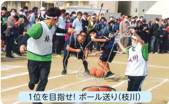
1位を目指せ! ボール送り(枝川)