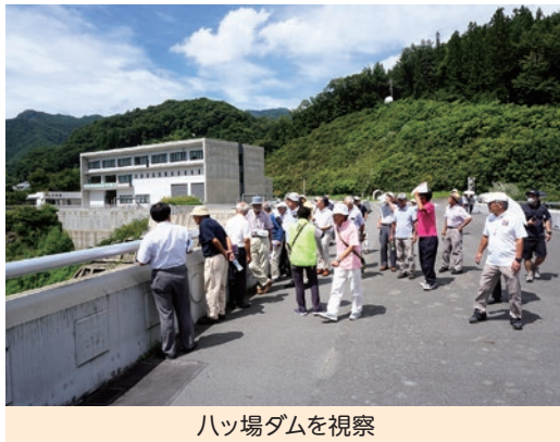
ハツ場ダムを視察

8月30日(水)～31日(木)の2日間の行程で研修会を実施しました。本会の理事・幹事・事務局員33名が参加しました。コロナ過の影響により4年振りの視察・研修会でした。初日は、群馬県伊香保「おもちゃと人形・自動車博物館」と「水沢観音」参拝や伊香保石段街を散策し、宿泊先の伊香保温泉「天坊」に到着しました。二日目は、一時工事中止等の話題となった「ハツ場ダム」と「碓氷峠鉄道文化むら」の視察を行い帰路につきました。今回の研修会では、各自治会の皆さんで話し合いと懇談が図られ、有意義な2日間となりました。