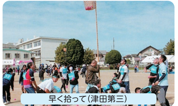
早く拾って(津田第三)