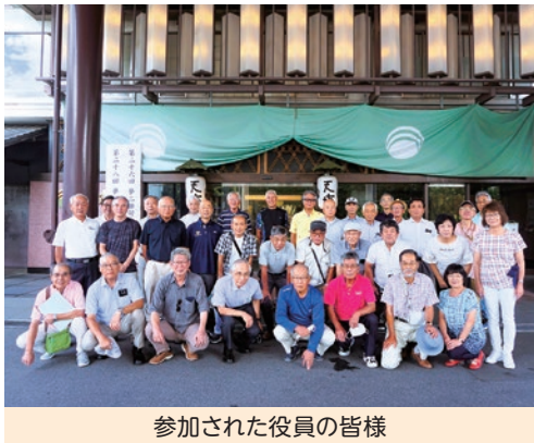
参加された役員の皆様