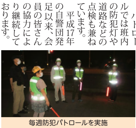
毎週防犯パトロールを実施

枝川自治会の取り組みの一端を紹介いたします。枝川は六つの班があり、各班長を中心に組長や防犯連絡員の協力を得て、班内の防犯パトロールを毎週行っています。曜日や時間は各班で決めて実施しています。パトロールでは班内の防犯灯や道路などの点検も兼ねています。平成17年の自警団発足以来、会員の皆さん協力により継続しております。