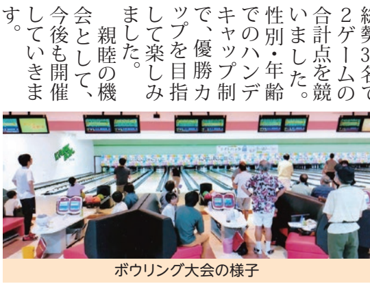
ボウリング大会の様子

8月6日(日)に、休催中の夏祭り代わる行事として、ボウリング大会を開催しました。競技は幼児から80才を超える方々まで、総勢30名で2ゲームの合計点を競いました。性別・年齢でのハンデキャップ制で、優勝カップを目指して楽しみました。親睦の機会として、今後開催していきます。