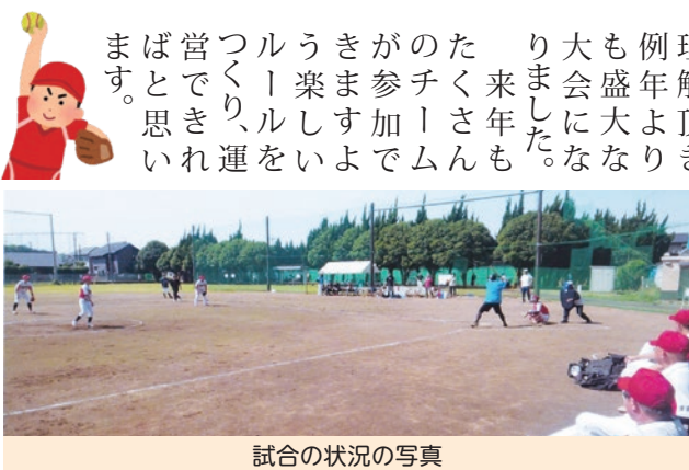
試合の状況の写真

6月18日(日)に津田グラウンドにおいて「第38回ソフトボール大会」を実施しました。約122名(8チーム)参加して頂きました。今年はチームの実力の差を解消するために試合前に強いチームは弱いチームの要望に合わせた試合をしてもらいました。(例えばウインドミル投球禁止や十人参加等)。その結果、親睦目的のローカルルールをご理解頂き、例年より大会にも盛大な来年もたくさん参加できました。ルールをい