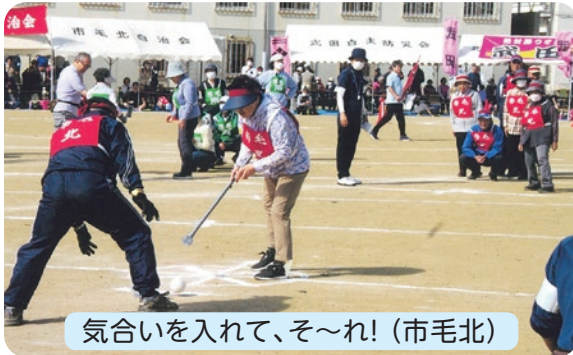
気合いを入れて、そ~れ!(市毛北)