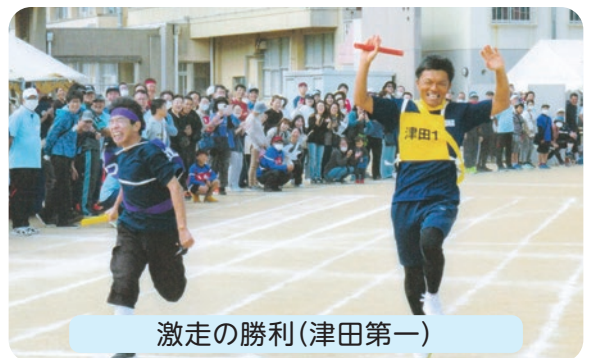
激走の勝利(津田第一)