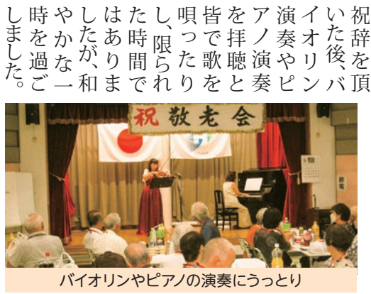
バイオリンやピアノの演奏にうっとり

当日は76名の方が参加され、久し振りに顔を合わせ近況報告等に話が弾みました。式典では褒状授与や来賓からご祝辞を頂いた後、バイオリン演奏やピアノの演奏にうっとり