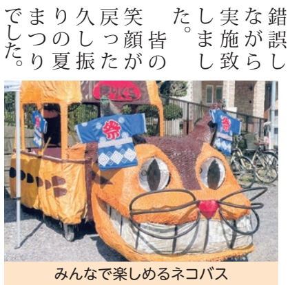
みんなで楽しめるネコバス

第45回堀口夏まつりを4年振りに無事開催することができました。新型コロナウイルス感染症の影響で3年間開催することができませんでした。今年度は各行事が復活しました。夏まつりも自治会役員や各種団体と話し合いを重ね、皆で試行錯誤しながら実施しました。笑顔が戻った久し振りの夏まつりでした。