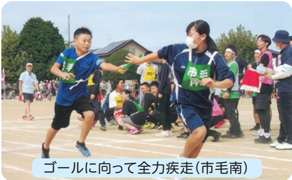
ゴールに向かって全力疾走(市毛南)