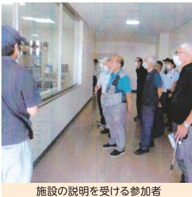
施設の説明を受ける参加者

9月12日(火)10時から市毛にある、ひたちなか市の上坪浄水場を9名で見学しました。当日、施設職員より施設の概況、水道水が出来るまでの行程等を分かりやすく説明を受けました。