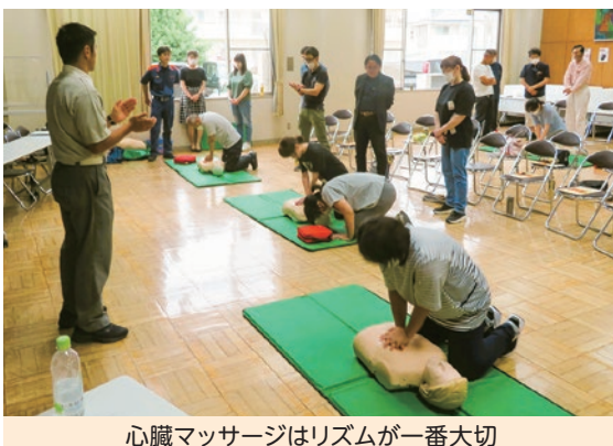
心臓マッサージはリズムが一番大切

7月9日(日)救急救命の知識と技術を身につけようと部会研修を開催しました。部会委員22名が参加して、DVDによる説明に続いて、心臓マッサージの仕方やAEDの使い方と、周囲の人への協力の依頼や注意・指示の仕方等について熱心に受講しました。初めてという方が多く、13名が新たに消防本部から終了証を受けました。いざという時、今後に生きる内容でした。