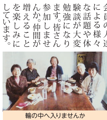
輪の中へ入りませんか

「らんの会」は、運動の苦手な人、足・腰の弱い人たちが参加し、お花見会・遠足など歩いて行ける範囲で活動をしています。簡単な足腰のストレッチなど、会員の人達による様々な話題や体験談が大変勉強になります。皆さん参加しませんか。仲間が増えることを楽しみにしています。