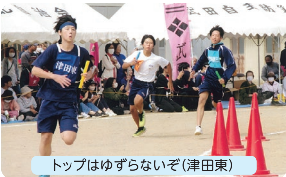
トップはゆずらないぞ(津田東)