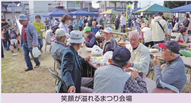
笑顔が溢れるまつり会場

10月14日(土)秋晴れの中、西山公園にて『西山ふれあいまつり』を開催いたしました。明るく・楽しく・のんびりとをテーマに、四世代の方々が交流する場となります。微笑ましい模擬店でのやりとりや、ゲームコーナーに真剣に挑む方、こどもコーナーの子ども達の楽しげな歓声等、多くの地域の方々が集う、楽しい「おまつり」となりました。