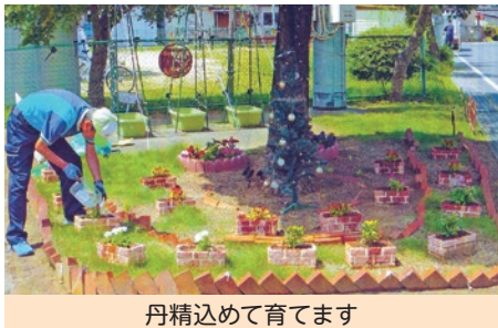
丹精込めて育てます

今後とも花壇整備による環境美化を通じて、地域の活性化を図り、安らぎを与える憩いの場所になればと願っています。