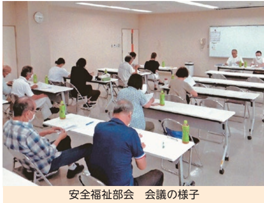
安全福祉部会 会議の様子

7月15日(土)に部会の全体会議を開催しました。一中学区内11の自治会選出委員と、4校の小学校交通安全母の会選出委員の方々が出席されました。第一回目の会議でしたので、令和5年度の役員・部会員紹介、事業計画の概要を説明しました。