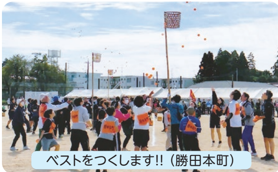
ベストをつくします!!(勝田本町)