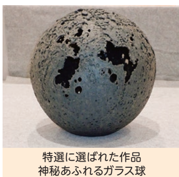
特選に選ばれた作品 神秘あふれるガラス球

今回の作品は「内包して」と題しての作品で、ごつごつした質感や色は、身の回りにあるガラスとは全く違った印象で、球体内部にため込んだエネルギーを感じさせる独創的な作品に仕上がった。この高い評価で「特賞」に選ばれたようです。