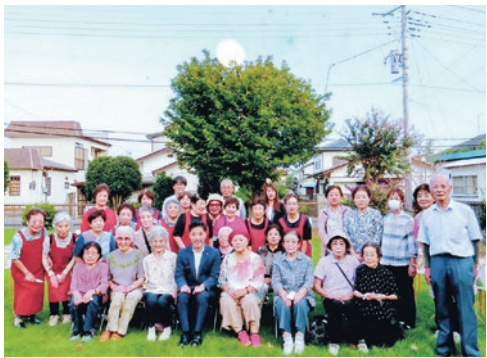
お月見会の参加者の皆さん

館庭の桜の木上には1日早く中秋の名月(っ)が輝き、お月見の意義に思いを寄せながら、久し振りに和やかな交流が図られたお月見会となりました。