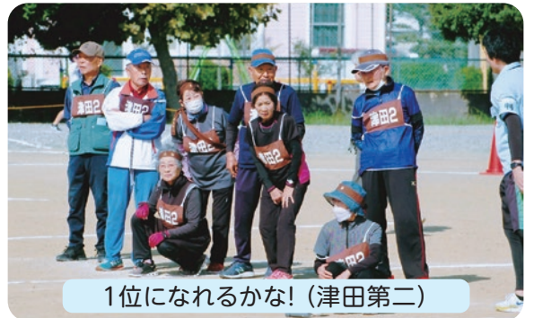
1位になれるかな!(津田第二)