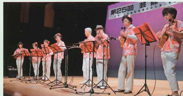
スイーツウクレレ