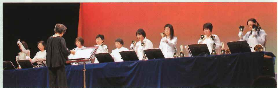
ハンドベルを楽しもう