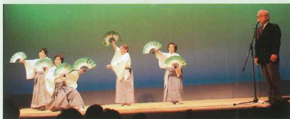
東中根団地自治会