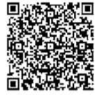
▲市HP (行事・公共施設等)