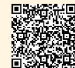
▲補助制度の詳細はこちら

災害や犯罪に強く、住宅取得の支援もあるなら安心して住むことができます。市では、地域と連携しながら安全・安心に住めるまちづくりを進めています。