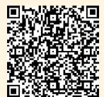
▲補助制度の詳細はこちら

そのほかにも、結婚によって住宅を取得する、またはアパートを借りる費用などについても支援を行っています(所得や期間制限があります)。