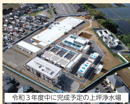
令和3年度中に完成予定の上坪浄水場

ほかにも、昭和56年以前に建築された木造住宅の耐震診断・耐震改修や、危険なブロック塀の撤去工事費に対する補助を行っています。