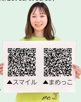
▲スマイル ▲まめっこ