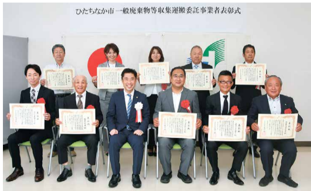
ひたちなか市一般廃棄物等収集運搬委託事業者表彰式