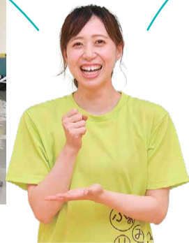
▲座談会グループAの皆さん。ふあみりこスタッフも加わり、子育ての話題は時間いっぱいまで尽きませんでした。