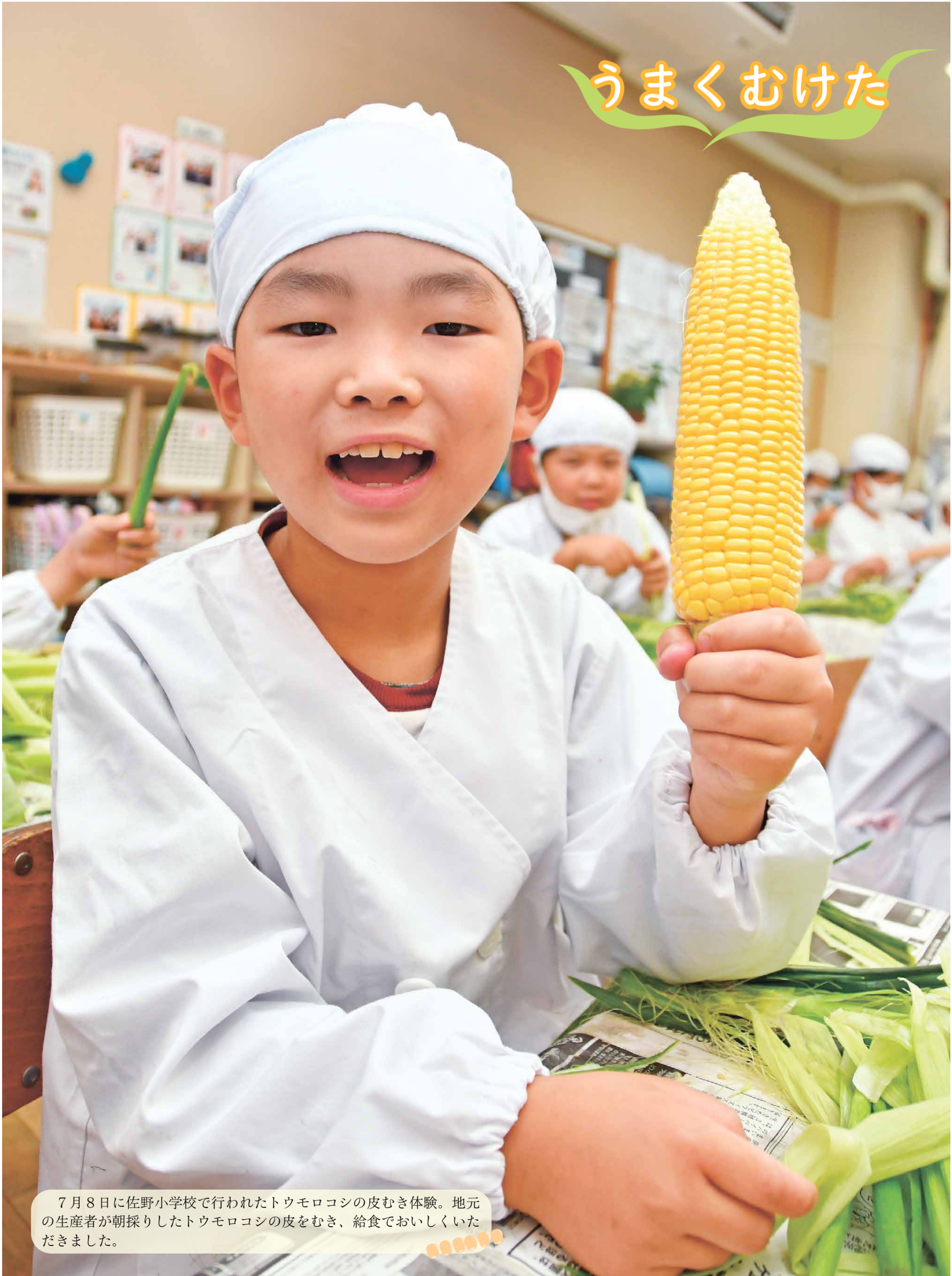
7月8日に佐野小学校で行われたトウモロコシの皮むき体験。地元の生産者が朝採りしたトウモロコシの皮をむき、給食でおいしくいただきました。

発行 ひたちなか市広報広聴課 ☎029(273)0111 編集 〒312-8501 ひたちなか市東石川2丁目10番1号