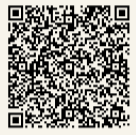
▲案内はがき申し込み登録ページ

Q. 市外に住民票を移してしまったのですが? A. 本市で出席を希望する方は、必ず「案内はがき申し込み登録ページ」から申し込みください。申し込みをした方には案内はがきを送付します。