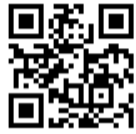
▲成人の集いブログ

※内容は、新成人で組織される実行委員会において協議・検討してまいります。詳しくは「ひたちなか市成人の集いブログ」をご覧ください。