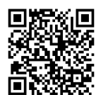
▲メール相談はこちら

○電話相談 275-0050 ○来所相談 市青少年相談室(ふあみりこらぼ1階) ○相談日 平日 8:30～12:00、13:00～17:00 土曜日 8:30～12:00 ※⑩⑪、年末年始を除く