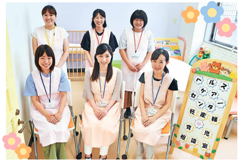
▲母子保健コーディネーター・保健師・助産師・管理栄養士など、専門のスタッフがお受けします

【問合せ】ヘルス・ケア・センター（健康推進課） ☎276-5222 松戸町1丁目14番1号