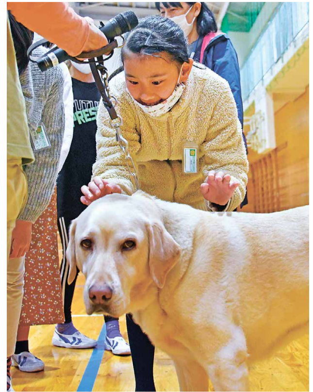
▲子どもたちに大人気の盲導犬