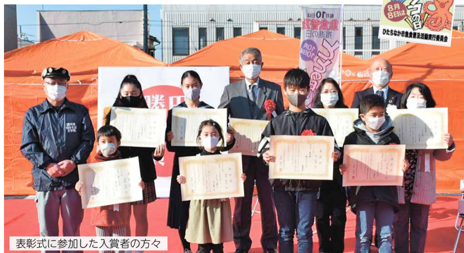
表彰式に参加した入賞者の方々