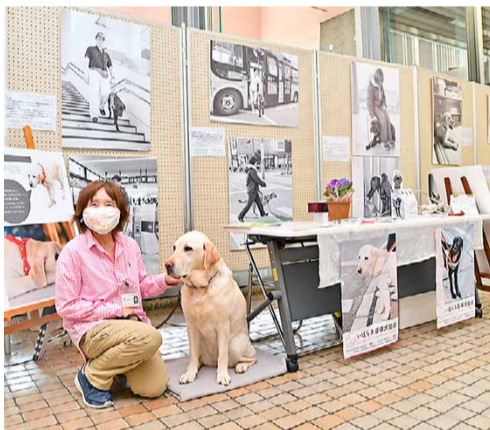
▲PR犬ステラが迎えてくれるパネル展示

また、PR活動とあわせて募金活動を行っています。会の運営と盲導犬育成に必要な財源の9割は、皆さまからの寄付金で賄われています。