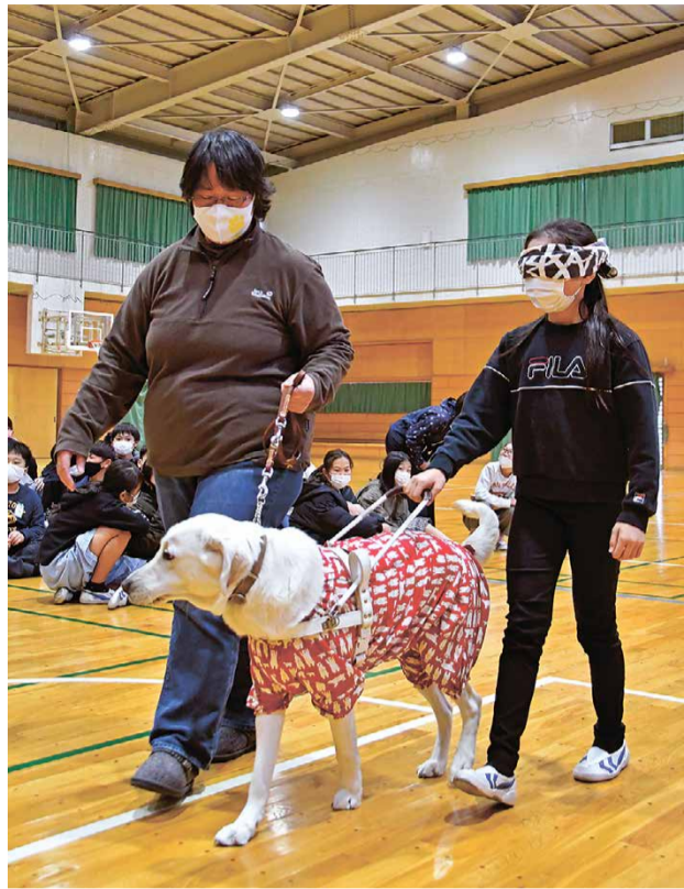
▲盲導犬の誘導を受けて体育館で歩行体験

授業には、5・6年生128人が参加。盲導犬育成団体「いばらき盲導犬協会」の協力のもと、盲導犬の役割や仕事、視覚障害に関する講話や、盲導犬との歩行体験などを行い、視覚障害者への思いやりの気持ちを持つことの大切さを学びました。