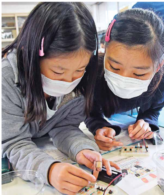
LEDを光らせる回路に興味津々の子どもたち

茨城工業高等専門学校では、学生のものづくりの能力を重視し、時代をリードする創造力を育てることで、世界基準の教育および技術者の育成を行っています。 平成22年には、市と包括的な連携協力に関する協定を締結し、地域の人材育成や生涯学習の推進など、さまざまな分野で連携・協力をしています。