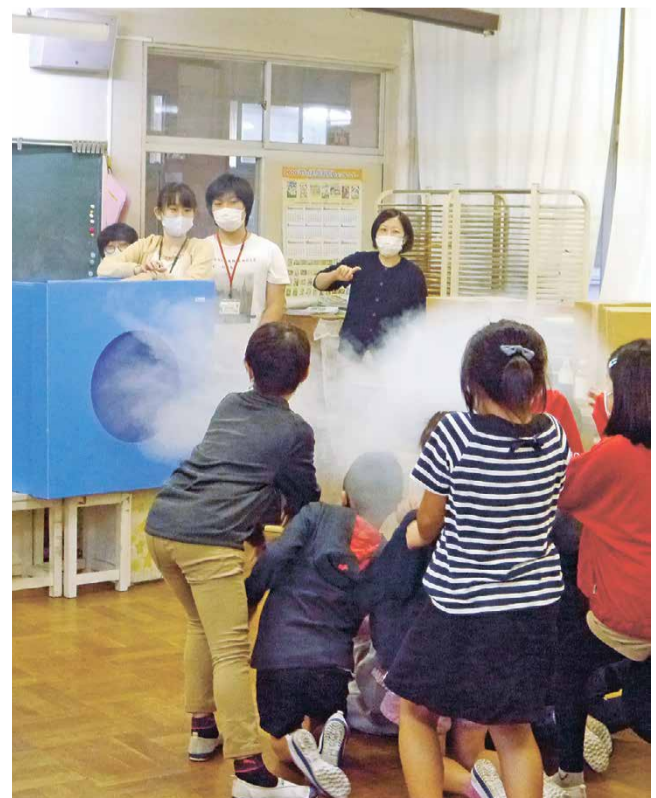
段ボールで作った「空気砲」を体験