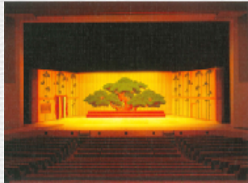
文化会館大ホール