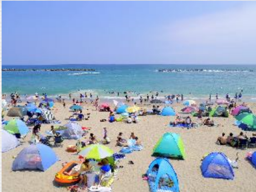
【阿字ヶ浦海水浴場】