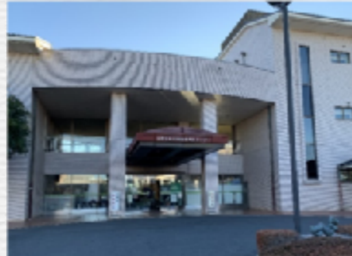
総合福祉センター