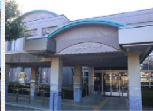
那珂湊総合福祉センター