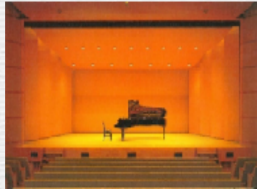
文化会館小ホール