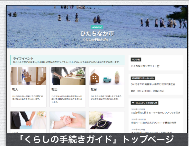
「くらしの手続きガイド」トップページ