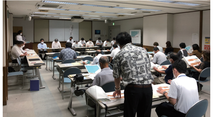
質問をする地権者