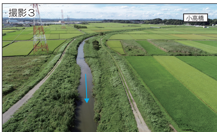
上流部の現況【小高橋 - 市枝橋】