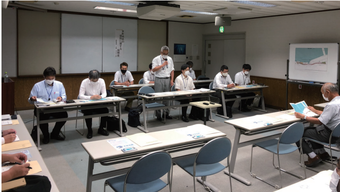
常陸河川国道事務所の挨拶

令和3年7月29日（木）に、ひたちなか市栄町地区における堤防整備に伴い、那珂川緊急治水対策プロジェクトの概要及び築堤計画、用地取得までの流れ等を常陸河川国道事務所から協力をお願いする地権者へ説明しました。