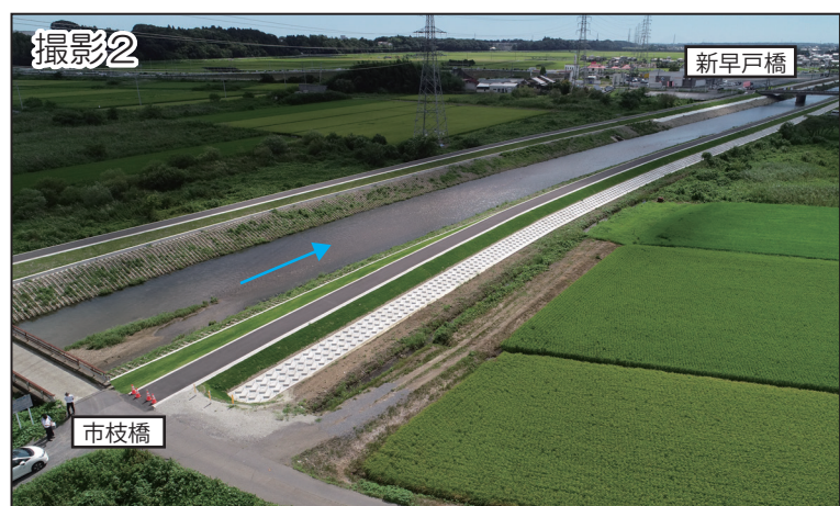
堤防法尻の補強状況【市枝橋 - 新早戸橋】