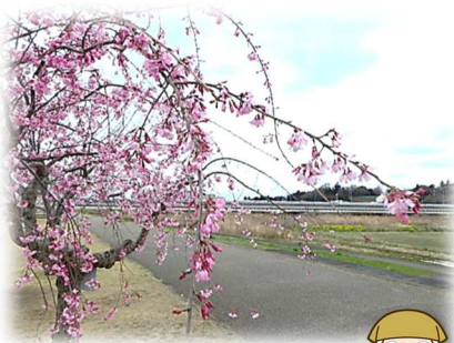
木曾川堤（サクラ）のエドヒガンと水府橋