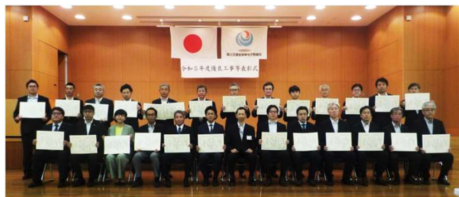
事務所長表彰を受賞された方々