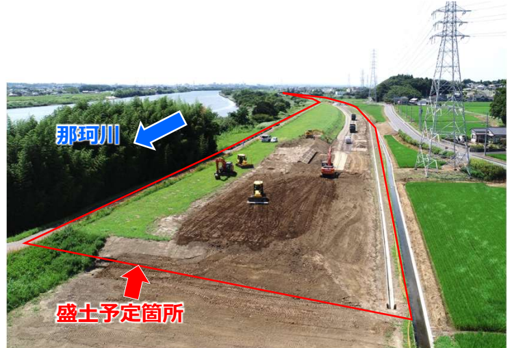
築堤予定箇所（ひたちなか市三反田地区）