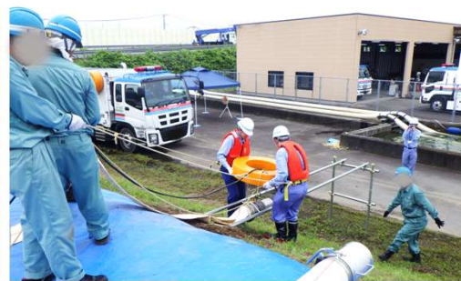
排水ポンプを設置する訓練の様子