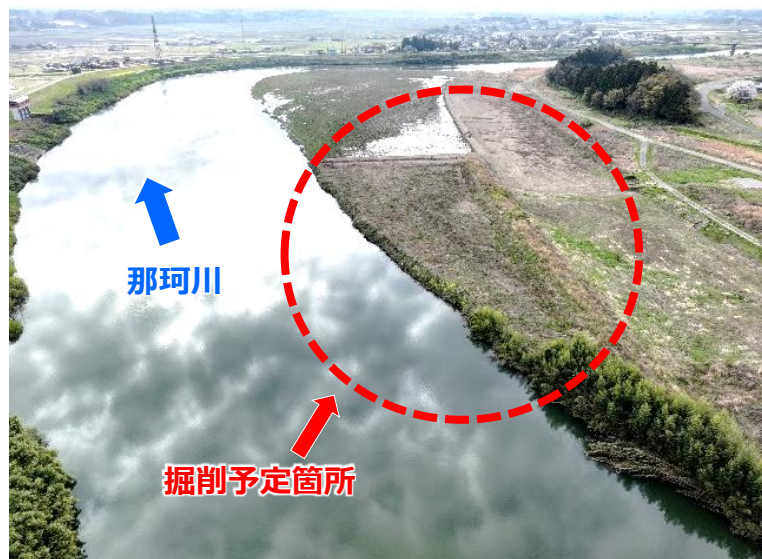
河道掘削予定箇所（水戸市渡里町）

○ R4那珂川那珂管内周辺整備工事は、水戸市渡里町において、河川敷を掘削して洪水の流れる断面を拡げ、洪水の際の川の水位を低下させるための河道掘削を実施するものです。掘削した土砂は今後、堤防整備に有効に活用する予定です。