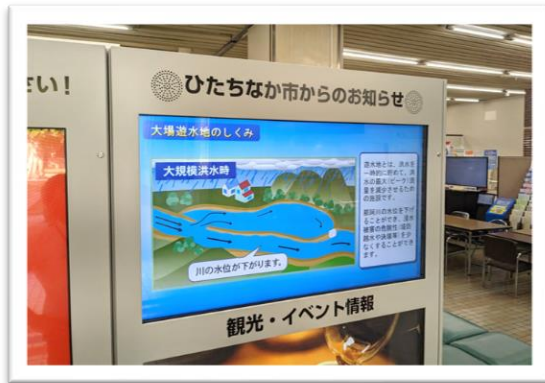
ひたちなか市役所