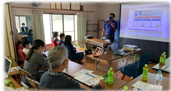
マイ・タイムライン講習の様子 ▶