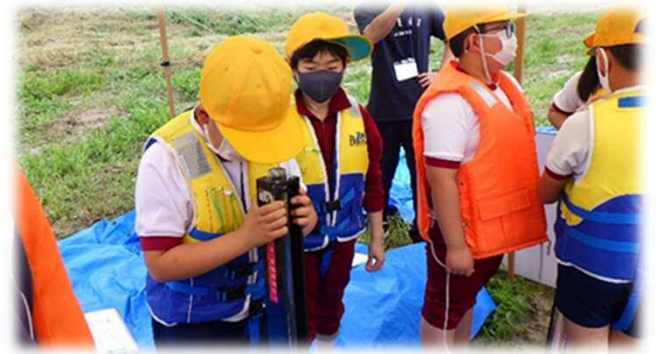
川の透明度の測定