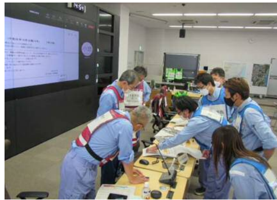
緊急復旧工法の検討