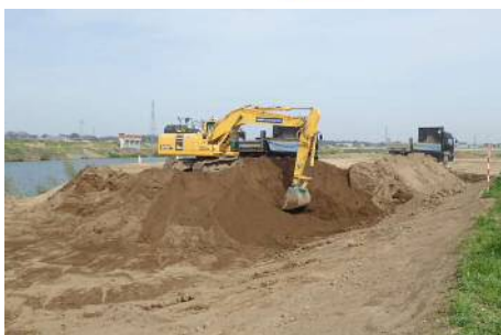
河道掘削の状況（渡里地区）

令和元年台風19号による洪水で決壊した堤防を24時間体制で復旧作業を行った際、地域の方から笑顔で感謝の言葉をかけていただいたことは、忘れることはありません。一日でも早く、安心して安全な環境が実現できるよう会社一丸となって取り組んでいきます。