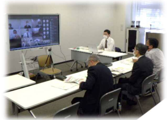
水防連絡会の開催状況（オンライン）