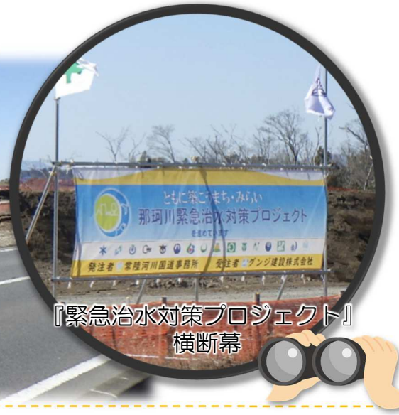
『緊急治水対策プロジェクト』 横断幕