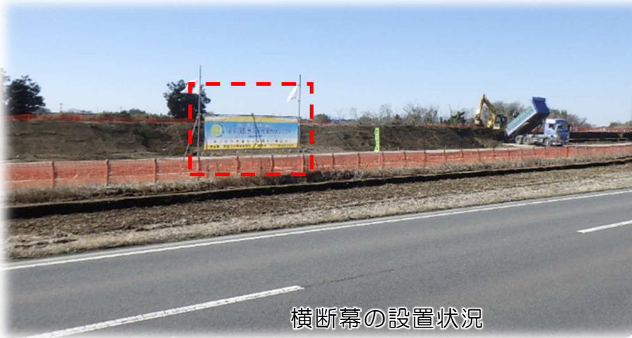
横断幕の設置状況