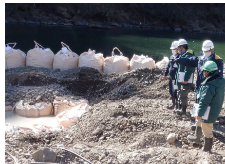
安全パトロール実施の様子