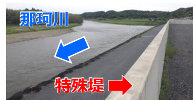
上流工区からの眺め （下流から上流）