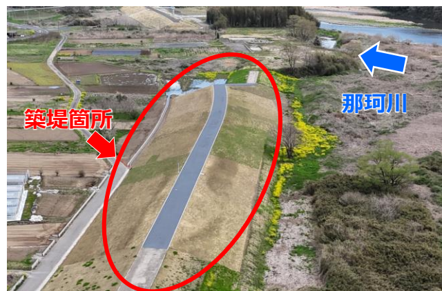
下流工区築堤箇所（上流から下流）