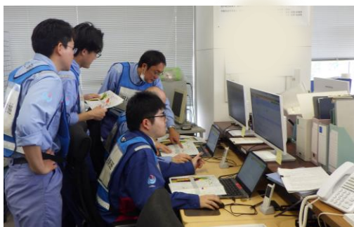
地方气象台と連絡をとって 洪水予報を作成