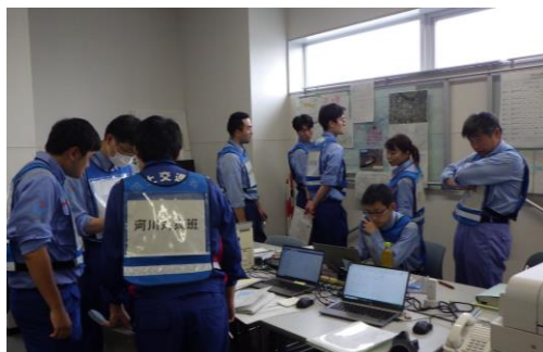
緊急復旧工法の検討