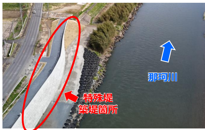
上流工区築堤箇所（上流から下流）