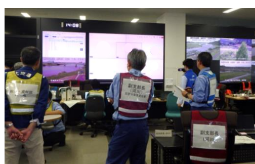
自治体とのホットライン訓練