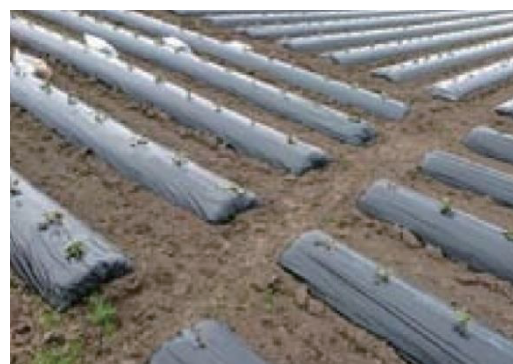
枕畝途中に設置した排水路