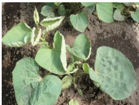
株の葉巻、萎縮症状