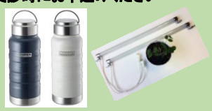
ステンレス水筒 植物育成LED 550ml

1年後再受診し事後アンケートを提出いただいた方には ・ステンレス水筒(1本) ・植物育成LED(1灯) プレゼント！